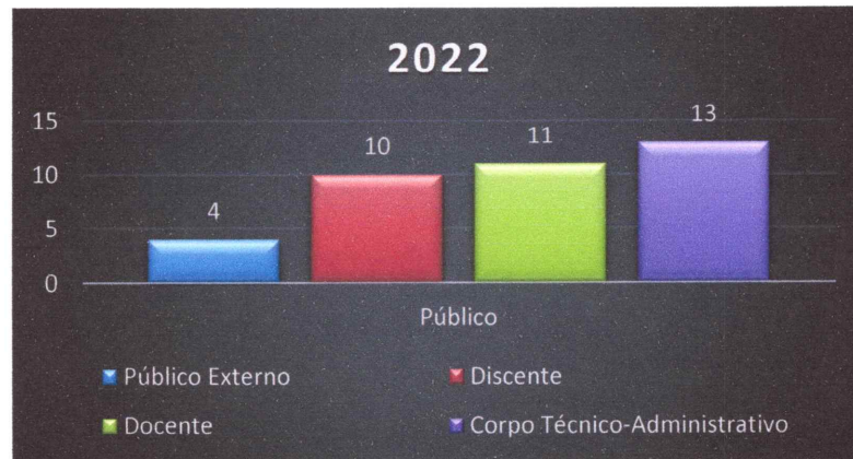
Gráfico 04 – Número de demandas registradas no período, conforme o público:

A Ouvidoria encaminha as solicitações, imediatamente, após registro do solicitante. O prazo médio estabelecido por esta Ouvidoria para os setores e/ou responsáveis se manifestarem quanto as demandas é de 10 dias. De modo geral, as manifestações são respondidas em um tempo razoável.