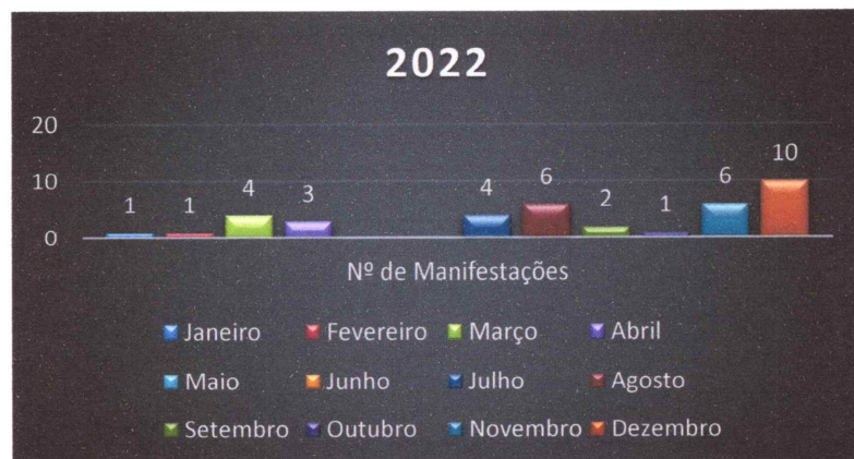
Gráfico 01 – Número de manifestações registradas no período

No ano de 2022 a Ouvidoria do Centro Universitário Fluminense recebeu 38 (trinta e oito) manifestações. O gráfico a seguir demonstra o volume de manifestações recebidas mês a mês.