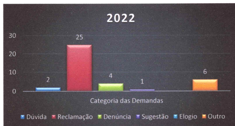
Gráfico 3 – Número de demandas registradas no período, conforme categoria:

As demandas recebidas na Ouvidoria são classificadas em seis categorias: Dúvida, Reclamação, Denúncia, Sugestão, Elogio e Outros . Conforme apontado no Gráfico 03, no decurso do ano de 2022, dos 38 (trinta e oito) registros feitos 02 (dois) foram referentes a dúvidas, 01 (um) sugestão, 06 (seis) outros, 25 (vinte e cinco) reclamações e 04 (quatro) denúncias.