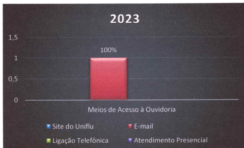
Gráfico 02 – Número de demandas registradas no período, conforme tipo de acesso:

As demandas recebidas na Ouvidoria são classificadas em seis categorias: Dúvida, Reclamação, Denúncia, Sugestão, Elogio e Outros . Conforme apontado no Gráfico 03, no decurso do ano de 2023, dos 12 (doze) registros feitos 03 (três) foram de sugestões, 04 (quatro) reclamações, 01 (um) denúncia, 02 (dois) dúvidas e 02 (dois) outros.