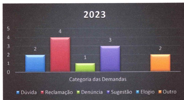
Gráfico 3 – Número de demandas registradas no período, conforme categoria:

As demandas recebidas na Ouvidoria são classificadas em seis categorias: Dúvida, Reclamação, Denúncia, Sugestão, Elogio e Outros . Conforme apontado no Gráfico 03, no decurso do ano de 2023, dos 12 (doze) registros feitos 03 (três) foram de sugestões, 04 (quatro) reclamações, 01 (um) denúncia, 02 (dois) dúvidas e 02 (dois) outros.