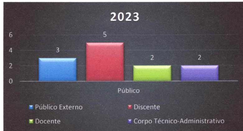
Gráfico 04 – Número de demandas registradas no período, conforme o público:

A Ouvidoria encaminha as solicitações, imediatamente, após registro do solicitante. O prazo médio estabelecido por esta Ouvidoria para os setores e/ou responsáveis se manifestarem quanto as demandas é de 10 dias. De modo geral, as manifestações são respondidas em um tempo razoável.