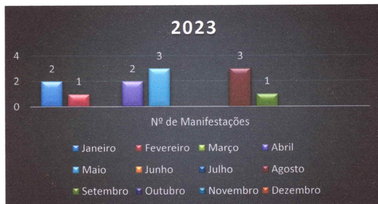
Gráfico 01 – Número de manifestações registradas no período

No ano de 2023 a Ouvidoria do Centro Universitário Fluminense recebeu 12 (doze) manifestações. O gráfico a seguir demonstra o volume de manifestações recebidas mês a mês.